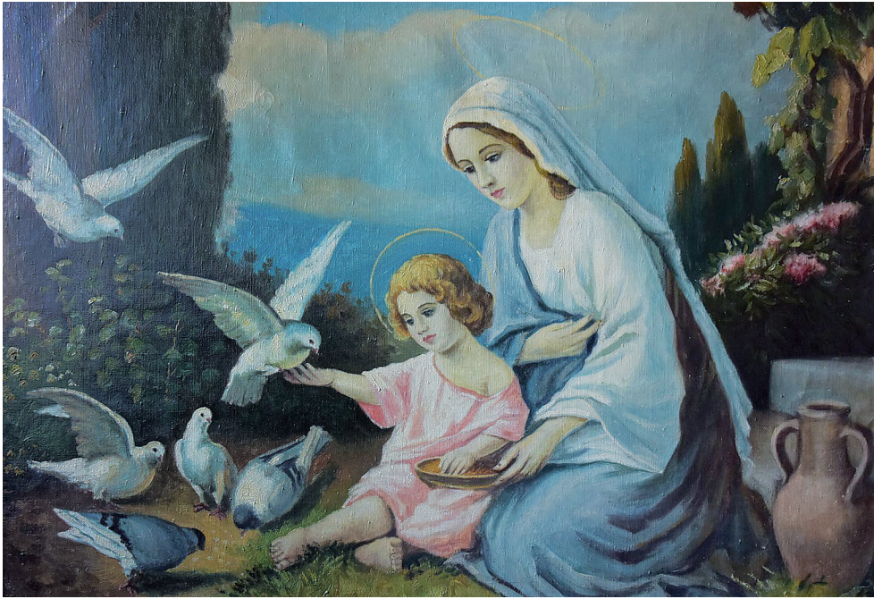
Célunk a szegények, elhagyottak segítése. Élelmiszerellátó-pont, Családi napközi, Keresztény szellemiségű játszóház üzemeltetése. Lelkigyakorlatok tartása. Kirándulások szervezése, lebonyolítása.