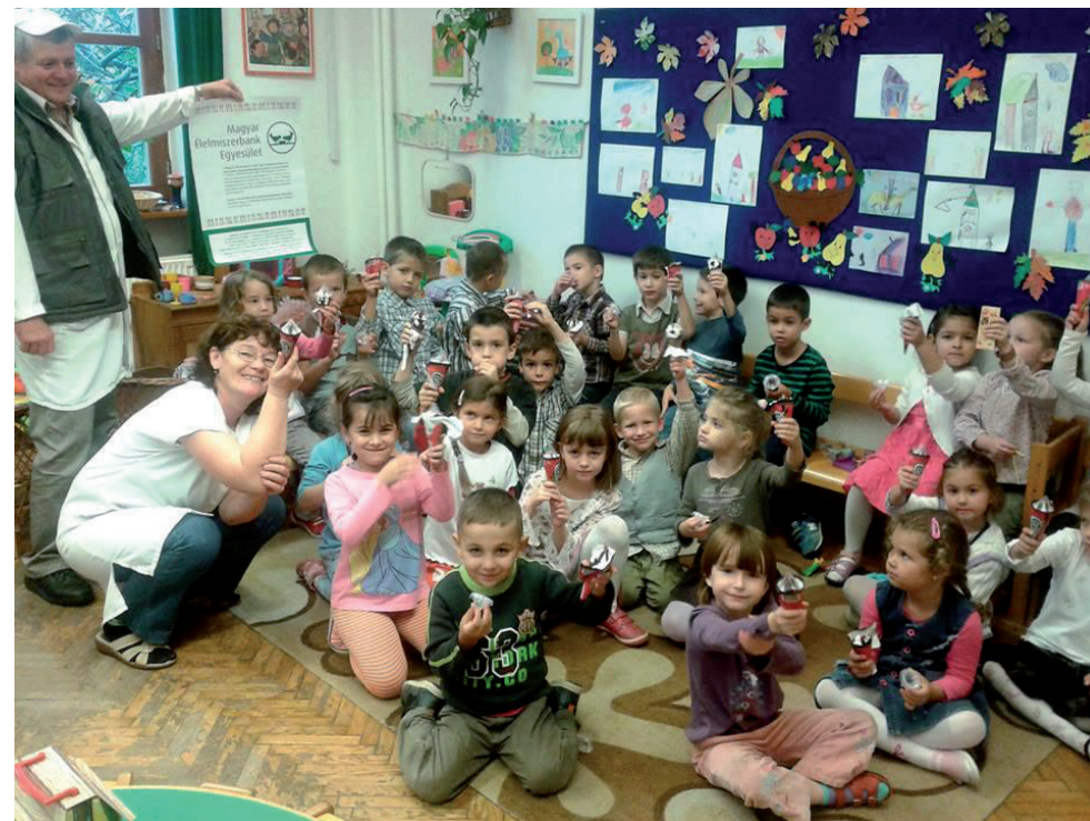
Fagyi adományozás - hét iskolának és óvodának

2015-ben eddig 6,9 millió forint adományt osztottunk szét, egyre több szociálisan rászoruló többgyermekes családoknak és időseknek. Tíz civil szervezettel és három önkormányzattal kötöttünk együttműködési megállapodást.