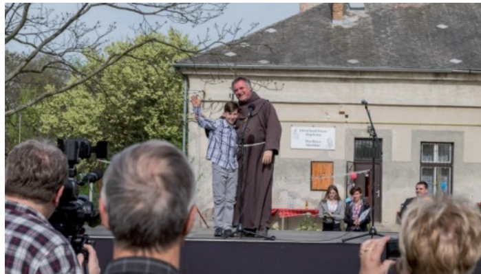
Első utunk alkalmával, a Dévai Szent Ferenc Alapítvány, Magyarországi Don Boscó iskolaházába vittünk adományt.