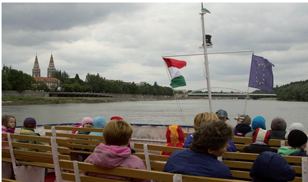
Sétahajózás a Tiszán