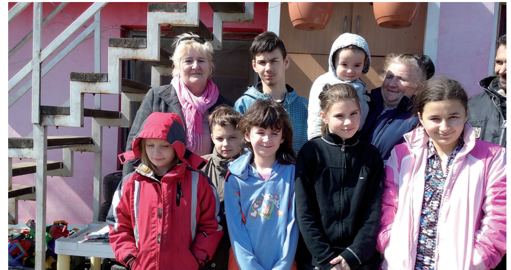
Boldogok a Szegények Alapítvány